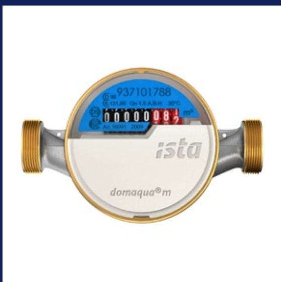
bytový vodoměr domaqua® m