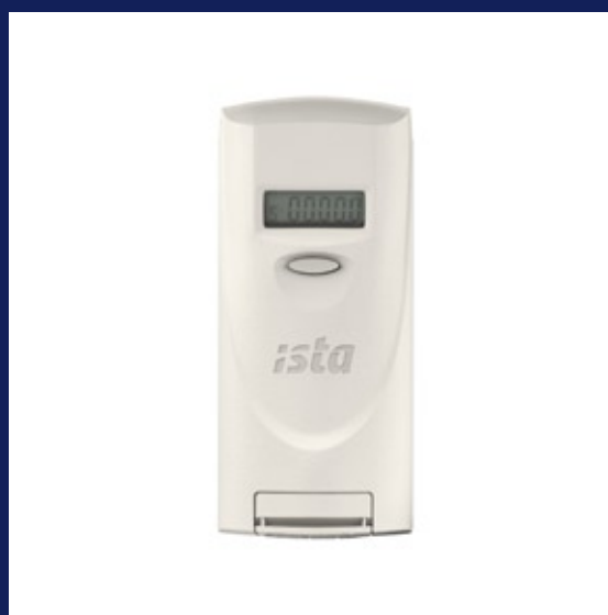
indikátor – rozdělovač topných nákladů doprimo® 3